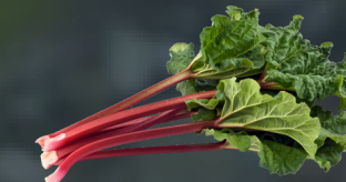
RUIBARBO Rheum rhabarbarum Propiedades antiinflamatorias y antioxidantes