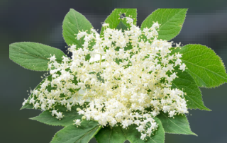
SAUCO Sambucus Tratamiento de trastornos digestivos, fiebre, tos y bronquitis