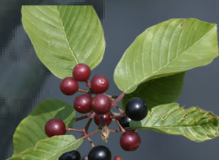
CASCARA SAGRADA Rhamnus purshiana Colagogo , colerético, Laxante, purgante .