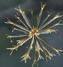
CADILLO Bidens Pilosa L Estimulante que desobstruye el hígado y alivia las indigestiones.