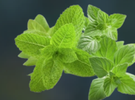
MENTA POLEO Mentha pulegium propiedades antiespasmódicas y digestivas