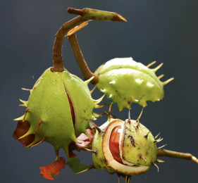
CASTAÑO DE INDIAS Aesculus hippocastanum Vasoprotector, descongestionante, circulatorio, anti-inflamatorio, anti-edema, venotónico.