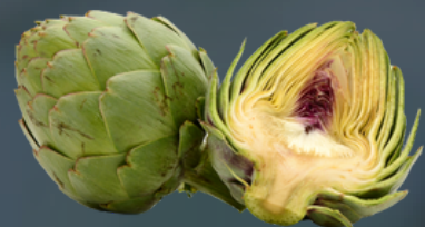
ALCACHOFA Cynara cardunculus var. scolymus Procesos que interviene con la digestión: eupéptica, cole rética, colagoga, antiemética y aperitiva.