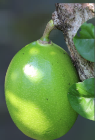
TOTUMO Crescentia cujete Es anti-hemorrágico, así mismo tiene compuestos que ayudan en la curación de enfermedades respiratorias leves