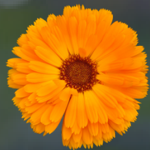
CALÉNDULA Calendula officinalis Cicatrizante, epitelizante .