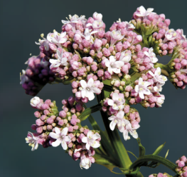
VALERIANA Valeriana officinalis Calmante, inductor del sueño