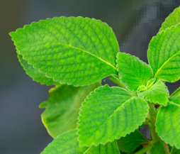
BOLDO Peumus boldus Laxante, acción digestiva, colagogo, colerético y hepatoprotector