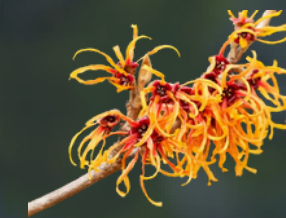
HAMAMELIS Hamamelis Astringente, hemostático y antihemorrágico.